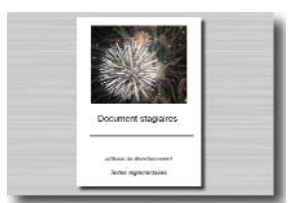
Recueil de textes