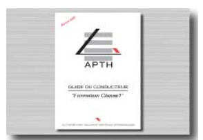
Document de stage