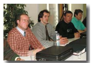
Exercice de préparation à l'examen