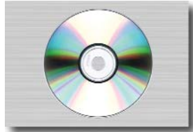
32 Présentations multimédia