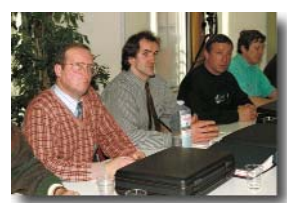
Exercice de préparation à l'examen