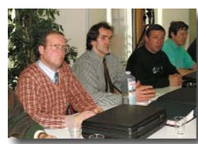
Exercice de préparation à l'examen