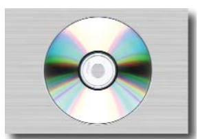
36 Présentation multimédia