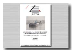
Documentation de stage