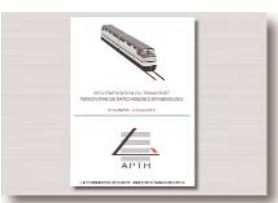
Documentation de stage