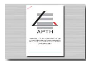
Document de stage