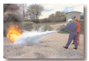
Exercice d'extinction de feu