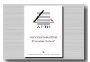
Documentation de stage