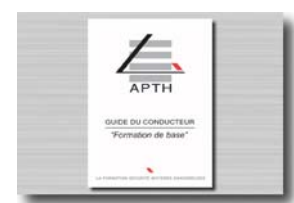
Documentation de stage