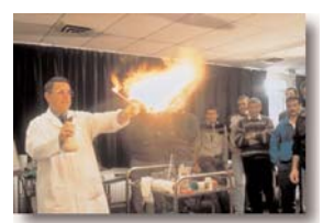
Présentation du règlement ADR