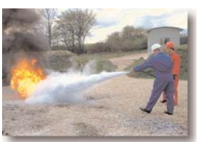
Exercice d'extinction de feux