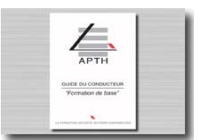
Documentation de stage