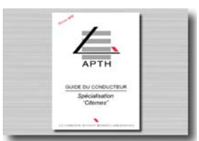
Documentation de stage